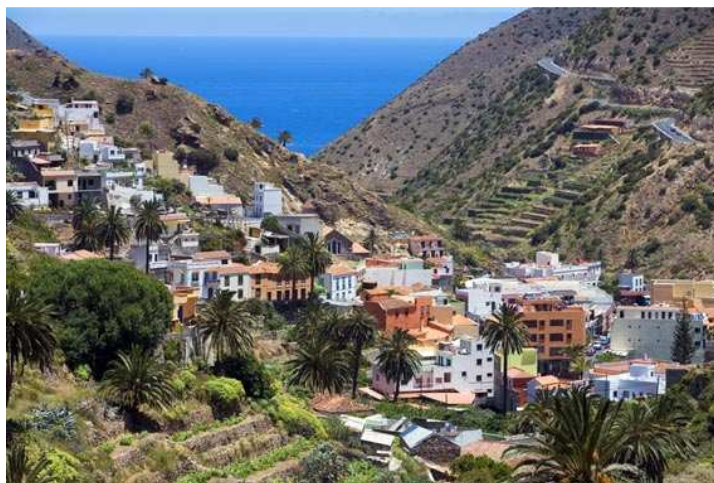
Municipio de Vallehermoso, en La Gomera

Esta acción de inmersión, intercambio y convivencia está promovida por el proyecto de ámbito nacional Campo Adentro – Arte, Agriculturas y Medio Rural, que ha seleccionado 14 propuestas de 18 artistas, que llevarán a cabo residencias en distintas localidades rurales del país hasta el 15 de septiembre.